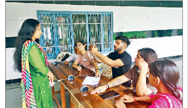
कैथल। अभ्यर्थियों की जांच करते कर्मचारी।

साथ अभ्यर्थियों की चेंकिंग के उपरांत प्रवेश करने की अनुमति दी। उडनदस्ते द्वारा अति-प्रभावी निरीक्षण कार्य किया गया। परीक्षा केंद्रों पर नियुक्त किए ड्यूटी मजिस्ट्रेट ने जैमर, कैमरे व अन्य व्यवस्थाओं का जायजा लिया।