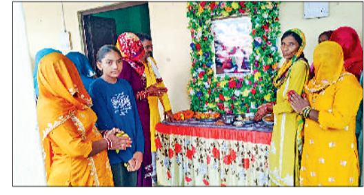
नरवाना। बातचीत करते कैबिनेट मंत्री कृष्ण लाल पवार।

नरवाना। नरवाना के डी मंगलम अम्बेडकर मठन में पत्रकारों से बातचीत करते अजित ने बताया कि मीके पर मिली जानकारी के अनुसार लोगों को कुछ साल पहले सरकार द्वारा 100-100 गज के प्लॉट प्लॉट दिये गये थे। लेकिन उन 100 गज के प्लॉटों में से करूना 90-90 गज के प्लॉट का दिया गया था। उनका कहना है कि जो 10-10 गज जमीन इस्तेमाल से रखी गई थी वो इस लिए रखी थी कि भविष्य में उसके काम आने वाली इमारत बनाई जाएगी जब भी समाज का कोई सामाजिक कार्य होगा उसमें उनका प्रयोग किया जायेगा लेकिन अब उस जमीन को उन्हें नहीं जा रहा है जिससे ये मामला वर्ष 2022 से चरआवा में आया है सरकार कोई रूखान नहीं ले रही है। पंचायत कैबिनेट मंत्री कृष्ण पवार गांव उखाना में पहुंचे और मीके का जांचा लिया गया वहां से नरवाना रोड हाउस पहुंचे और वहां पर गांव वालों से बात थीत की। उनसे बातचीत करने बाद डी मंगलम अम्बेडकर मठन में धरना प्रदर्शन पर बैठे लोगों से मिले और उनसे बातचीत की।