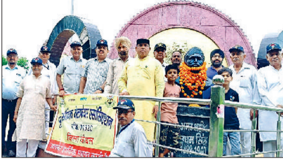
शहीद उधम सिंह पार्क में शहीद उधम सिंह को माल्यार्पण करते पूर्व सैनिक

हरिभूमि न्यूज. कैथल भारतीय स्वतंत्रता सेनानी जिन्होंने जलियांवाला बाग हत्याकांड का बदला बैसाखी के दिन 13 अप्रैल 1940 को लंदन में भाषण देते हुए लेफ्टिनेंट जनरल गवर्नर माइकल ओ डायर को बिल्कुल नजदीक पहुंचकर दो गोलियां मारी और ढेर कर दिया। आज उसे शहीद ए आजम माता नारायण कौर व सरदार टहल सिंह कंबोज के लाडले, गांव सुनाम जिला संगरूर के वीर सुपुत्र जिसने अपने देश,