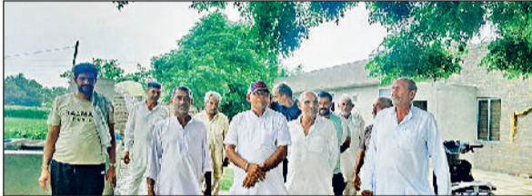
जीद। रोष जताते हुए किसान।