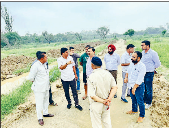
कैथल। हरियाणा सरस्वती विरासत विकास बोर्ड के वाइस चेयरमैन धुम्मन सिंह किरमच दौरा करते हुए।

सरस्वती बोर्ड द्वारा वन विभाग के सहयोग से सरस्वती संयोजक जंगल में लगभग 70 एकड़ क्षेत्र में रिजर्व वायर (संरक्षित क्षेत्र) विकसित किया जाएगा। इस महत्वाकांक्षी परियोजना को लेकर संबंधित अधिकारियों की ओर से स्थल का दौरा किया गया, जिसमें प्रस्तावित क्षेत्र का निरीक्षण किया गया और विभिन्न आवश्यकताओं पर चर्चा हुई। हरियाणा सरस्वती विरासत विकास बोर्ड के वाइस चेयरमैन धुम्मन सिंह किरमच ने कहा कि