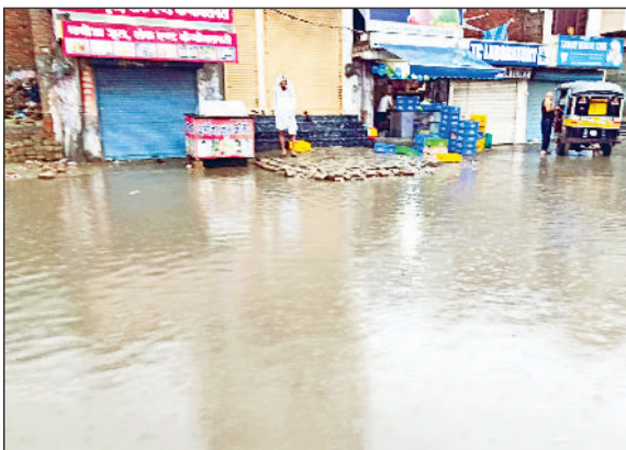
जीद। पटियाला चौक पर जमा हुआ बारिश का पानी।

दिनभर रूक-रूक फुहार पड़ती रही और मौसम सुहाना बना रहा। वीरवार को जिले में औसतन 16.57 एमएम बारिश दर्ज की गई। सबसे ज्यादा बारिश जुलाना में 31 एमएम दर्ज की गई। उचाना में बूंदबांदी दर्ज की गई। वीरवार को