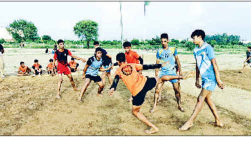
उचाना। कबड्डी के मैच में दमखम दिखाते खिलाड़ी।