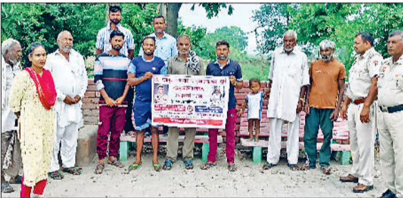
कैथल। नशा न करने बारे जागरूक करती हुई पुलिस टीम।