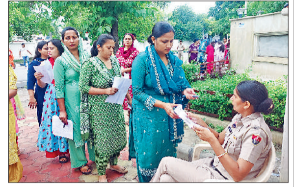
कैथल। एचएट परीक्षा को अभ्यर्थियों की जांच करते पुलिस व कंपनी के कर्मचारी।

संपन्न हुई तब तक पुलिस पीसीआर सेंटरों के बाहर मौजूद रही। वहीं खुफिया विंगों के कर्मी भी पृथक्ता करते नजर आए। इसके अलावा पेट्रोलिंग पार्टियां, बाइक राइडर व पीसीआर भी पात्रता परीक्षा के समय अपने-अपने क्षेत्र में गश्त पर रहे। वहीं यातायात पुलिस की तरफ शहर में यातायात व्यवस्था को सुचारू रूप से चलाने के लिए जींद शहर में नाकों पर भी अतिरिक्त पुलिस प्रबंध किया गया।