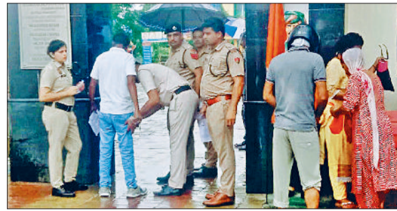
जींद। परीक्षा केंद्र में जाने से पहले परीक्षार्थियों की जांच करते हुए पुलिसकर्मी।

परीक्षा को नकल रहित बनाने के लिए किए गए थे पुख्ता प्रबंध