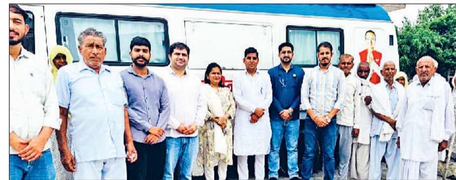
मेडिकल वैन के साथ टीम सदस्य।

गांव मुनारोहड़ी में नवीन जिन्दल फाउंडेशन द्वारा पंचायत घर में नवीन संकल्प जनसेवा शिविर का आयोजन किया गया। इस शिविर में ग्रामीणों को निःशुल्क स्वास्थ्य सेवाएं व प्रशासनिक सहायता उपलब्ध करवाई गई। शिविर में मेडिकल वैन के माध्यम से एमबीबीएस डॉक्टर द्वारा 66 मरीजों का स्वास्थ्य परीक्षण किया गया और मौके पर ही मुफ्त दवाइयों वितरित की गईं। 11 ग्रामीणों के रक्त और पेशाब की जांच भी निःशुल्क की गई, वहीं 12 लोगों को आधार कार्ड व फैमिली आईडी सहायता प्रदान की गई। शिविर का