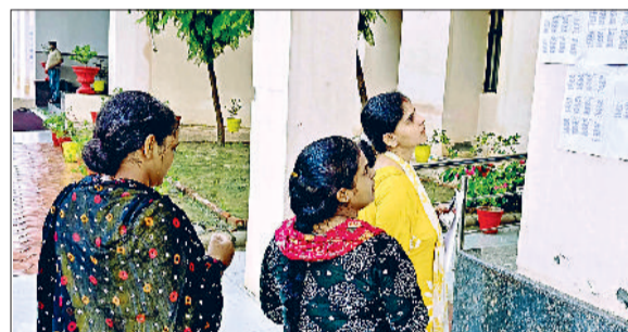
जींद। सटिंग प्लान देखते परीक्षार्थी।