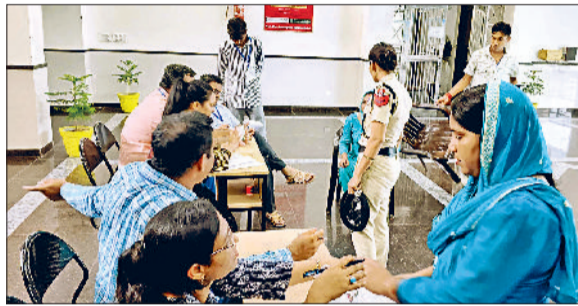
जींद। परीक्षार्थी की बायोमेट्रिक मिलान करते हुए।