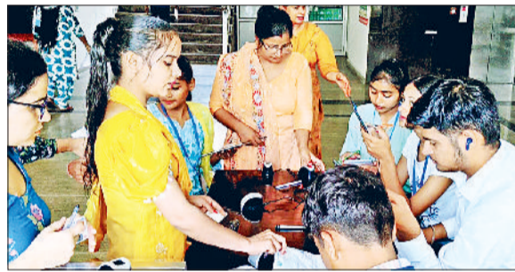
जींद। परीक्षा देने से पहले बायोमेट्रिक व फेस पिक लेते कर्मी।

पुलिस के अधिकारियों के साथ बनाए गए परीक्षा केंद्रों का निरीक्षण करते रहे। दोनों सत्र की परीक्षाएं सही समय पर शुरू हुईं। परीक्षा के दूसरे दिन भी नहीं बरती गई कोई लापरवाही: अध्यापक पात्रता परीक्षा को लेकर जिला प्रशासन द्वारा गुरुवार को भी कोई हिलाई नहीं बरती गई। किसी भी परीक्षार्थी को बिना जांच व पड़ताल के केंद्र में नहीं जाने दिया गया। गहन जांच के बाद ही परीक्षार्थियों को परीक्षा केंद्र के अंदर जाने दिया गया। इस दौरान कई परीक्षार्थी ऐसे थे जिनके फोटो का मिलान नहीं हुआ साथ ही बायोमेट्रिक में परशानी आई। परीक्षार्थी के आईडी शूफ को सख्ती से जांचा गया साथ ही परीक्षार्थी से पृथक्ता भी की गई। परीक्षा केंद्रों के बाहर सुबह ही लग गई थी लाइनें: गुरुवार को अध्यापक पात्रता परीक्षा दो सत्रों होने के कारण परीक्षा केंद्रों पर परीक्षार्थियों की भारी भीड़ रही। इसके अलावा परीक्षा केंद्रों पर तैनात ड्यूटी पर सभी कर्मियों की कार्य प्रणाली का गंभीरता से आकलन किया गया। पर्याप्त पुलिसबल रहा तैनात: परीक्षा को शांति पूर्ण तरीके से करवाने के लिए जिला प्रशासन द्वारा व्यापक प्रबंध किए गए थे। सुरक्षा की दृष्टि से सभी परीक्षा केंद्रों में पर्याप्त पुलिस कर्मियों की तैनाती को सुनिश्चित किया गया था। जबतक परीक्षा